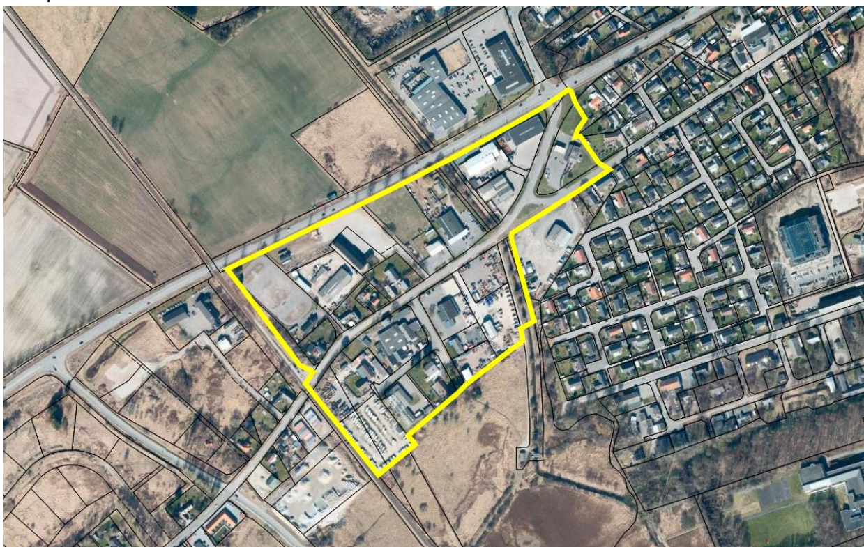
Lokalplanens afgrænsning er markeret med gult på kortet

Det indledende arbejde er nu gået i gang med at lave kommuneplantillæg og en ny lokalplan for erhvervsområde Hanehoved øst for banen i Frederiksværk. Halsnæs Kommune opfordrer alle interesserede til at sende bemærkninger, ideer eller forslag til kommuneplantillægget og lokalplanen senest den 8. marts 2023 .